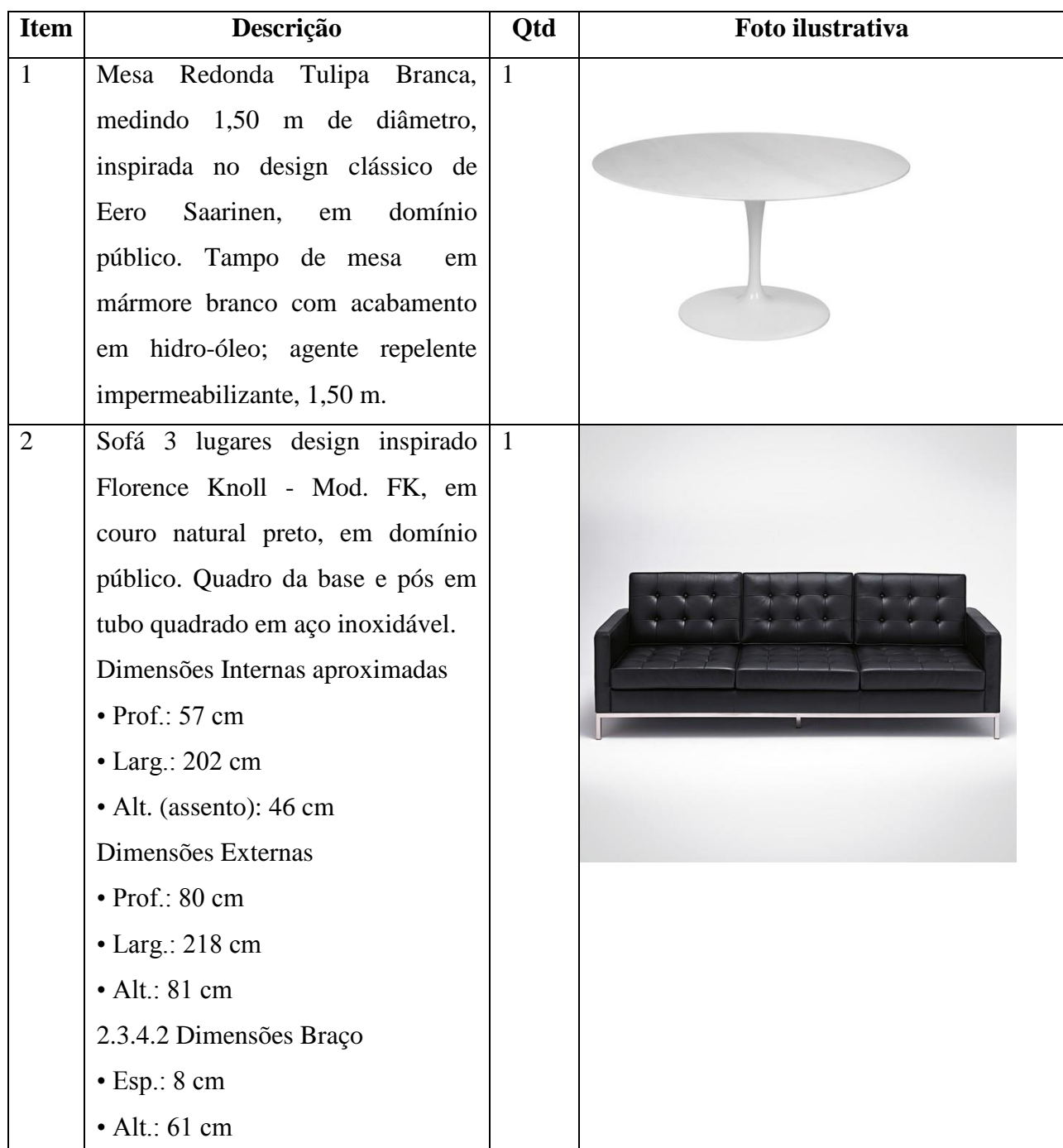
TABELA DE ITENS